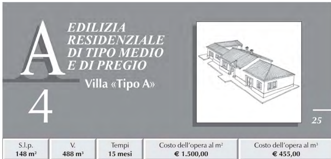
TABELLA RIASSUNTIVA DEI COSTI E PERCENTUALI D'INCIDENZA